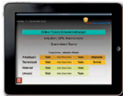
Die To-do-Liste mit stets aktuellen Daten ist immer dabei.

Neben der Vor-Ort-Dokumentation erleichtern iPhone und FileMaker Go auch das Tagesgeschäft. So lassen sich neue Schadensmeldungen – auch ohne schriftlichen Auftrag – vor Ort direkt per iPhone in Waiox diktieren und mit Fotos dokumentieren. Reparaturen, Materialverbrauch oder Schadenbeseitigungen können mit Unterschrift auf dem Smartphone quittiert werden. „Mit Waiox haben wir auch das Thema Zeiterfassung gelöst. Unsere Mitarbeiter erfassen ihre Arbeitszeiten direkt vor Ort. So erhalten wir die auf ein Objekt erbrachten, abzurechnenden Stunden“, erläutert Dübner. Darüber hinaus werden verwendetes Material, Mieter, Wohnungen oder Schlüssel der Objekte in der Datenbank verwaltet. Sämtliche Kommunikation mit den Kunden – Schadensmeldungen, Fotonachweise, Erfüllungslisten, aber auch Einzel-, Sammel- oder Jahresrechnungen –