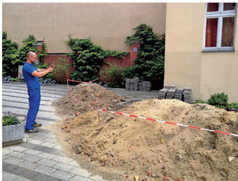
Zur rechtssicheren Dokumentation dient ein mit iPhone und GPS-Erkennung aufgenommenes und in Waiox abgelegtes Foto der erledigten Arbeit.